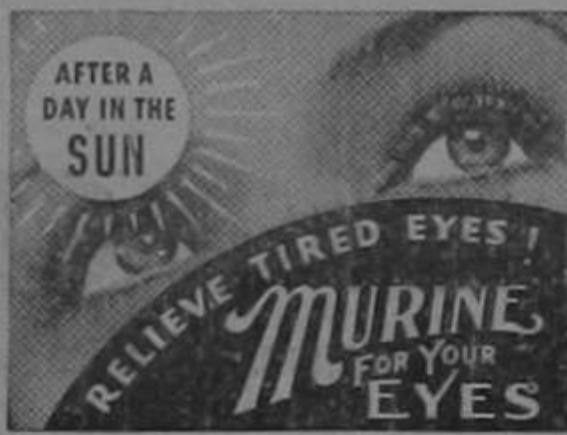
Relieve tired eyes! Murine for your eyes.

We shall be glad to hear of the ultimate results.